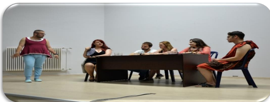
Θεατρική Παράσταση στην Αίθουσα Τελετών

Στην κτιριακή υποδομή περιλαμβάνονται μία Αίθουσα Τελετών 200 θέσεων, τέσσερις Αίθουσες Διδασκαλίας 50 θέσεων η κάθε μία και δύο Αμφιθέατρα 150 θέσεων το κάθε ένα. Η Εργαστηριακή υποδομή περιλαμβάνει τρεις Εργαστηριακές Αίθουσες και ένα Σχεδιαστήριο με σύγχρονη υλικοτεχνική υποδομή. Τα εργαστήρια έχουν οργανωθεί σε πολυεργαστήρια όπου συστεγάζονται συγγενή γνωστικά αντικείμενα. επίσης, λειτουργεί σύγχρονο εργαστήριο Ηλεκτρονικών Υπολογιστών. Στην υποδομή αυτή εντάχθηκε το 2003 το κτίριο των εργαστηρίων που περιλαμβάνει 9 εργαστήρια με βοηθητικούς χώρους και 25 γραφεία. Ακόμη, λειτουργεί πλήρως ένα Αναγνωστήριο και μία Αίθουσα Ηλεκτρονικών Υπολογιστών για τη διευκόλυνση της μελέτης των φοιτητών, καθώς επίσης και μία σύγχρονη Βιβλιοθήκη που αριθμεί 8.500 βιβλία και συνεχώς εμπλουτίζεται.