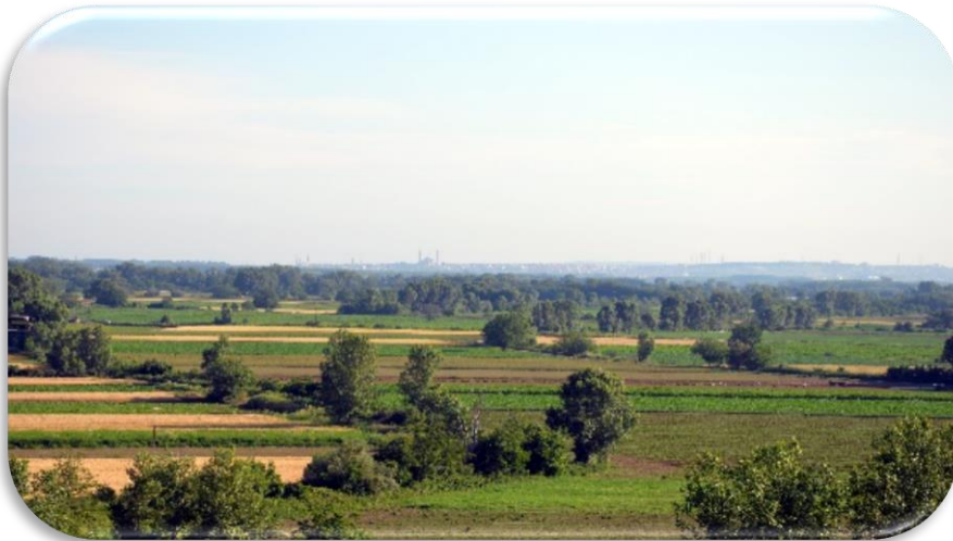
Η περιοχή των Καστανιών και στο βάθος η Αδριανούπολη

Η περιοχή της Νέας Ορεστιάδας είναι μία από τις εύφορες και παραγωγικές περιοχές της Ελλάδας με ύπαιθρο που διακρίνεται για την ομορφιά και τον πλούτο της.