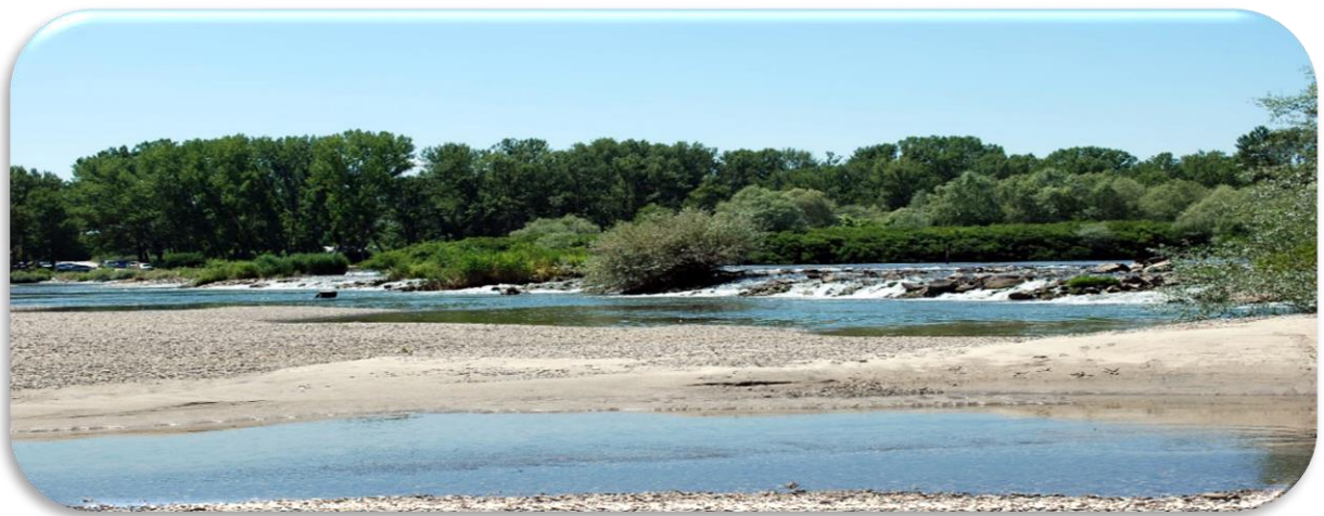
Ο ποταμός Άρδας

Στη Θράκη βρίσκονται σημαντικοί αρχαιολογικοί χώροι όπως: τα Άβδηρα, η Μαρώνεια, η Μεσημβρία, η Σαμοθράκη, η Μικρή Δοξιπάρα, καθώς και εξαιρετικής σημασίας υδροβιότοποι, όπως το Δέλτα των ποταμών Νέστου και Έβρου και η λιμνοθάλασσα της Βιστωνίδας, οι οποίοι προστατεύονται από διεθνείς συνθήκες και οργανισμούς.