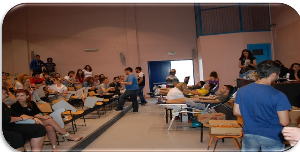
Εθελοντική Αιμοδοσία στο Αμφιθέατρο της Σχολής

Τα δύο Τμήματα που εδρεύουν στην Ορεστιάδα, το Τμήμα Δασολογίας και Διαχείρισης Περιβάλλοντος & Φυσικών Πόρων και το Τμήμα Αγροτικής Ανάπτυξης στεγάζονται σε τρία κτίρια που έχουν συνολικό εμβαδόν εγκαταστάσεων 5.486 τετραγωνικά μέτρα. Αναλυτικότερα, το Κεντρικό κτίριο με εμβαδόν 2.826 τετραγωνικά μέτρα, το κτίριο των αμφιθεάτρων με 791 τετραγωνικά μέτρα, το κτίριο των Εργαστηρίων με 1.800 τετραγωνικά μέτρα και το κυλικείο με 69 τετραγωνικά μέτρα. Η τοποθεσία του Πανεπιστημίου βρίσκεται μέσα στην πόλη της Ορεστιάδας.