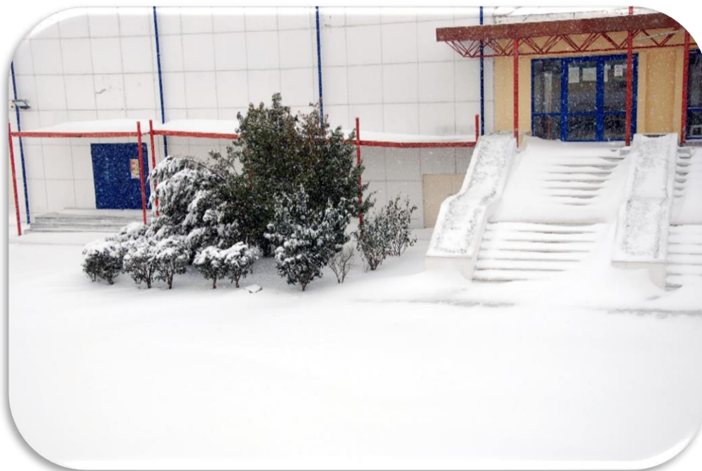
Εξωτερικός Χώρος της Σχολής