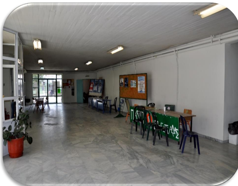
Εσωτερικός Χώρος για τις Δραστηριότητες των Φοιτητών